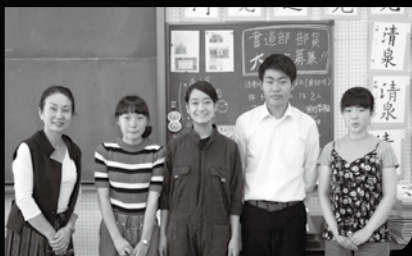
八尾高校書道部の皆さん

八尾市議会と、市内高校による企画がスタートしました。その記念すべき第1弾は議会だよりの表紙を八尾高校とコラボレーション。題字を八尾高校書道部に作成していただき、活動写真を掲載しました。今後の企画にもご期待ください。