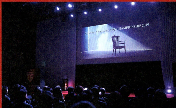
当日は学生とノミネート社長を含む約600名が来場しました。