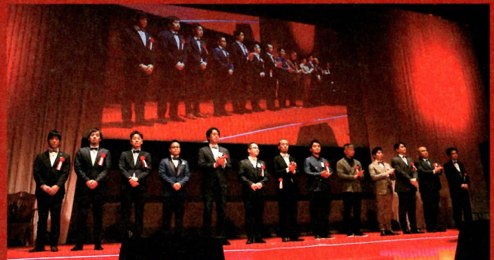
学生審査によって選出された社長たち。様々な業界の社長が選ばれました。